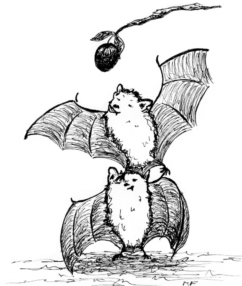
Illustration © Miriam Flemming

Konto Nr. 128 053 336, Nassauische Sparkasse, BLZ: 510 500 15 IBAN: DE77 5105 0015 0128 0533 36, BIC: NASSDE55XXX Freistellungsbescheid Finanzamt Wiesbaden (Steuer-Nr. 40 250 76215)